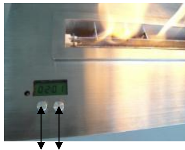
Apertura depósito 2 1 Botón on / off