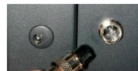
Contacto seco domótico